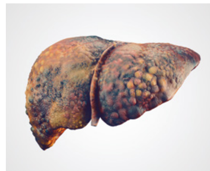
Représentation de cirrhose du foie.

Malheureusement, la cirrhose est un stade d'atteinte hépatique irréversible .