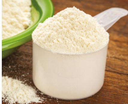
Protéines de petit-lait (ou whey) en poudre

culaire et bénéficier à la qualité de vie. Il est possible de prendre de la protéine de petit-lait ( whey ) ou, si elle n'est pas tolérée, des protéines végétales en poudre (à base d'isolat de protéine de riz ou de pois).